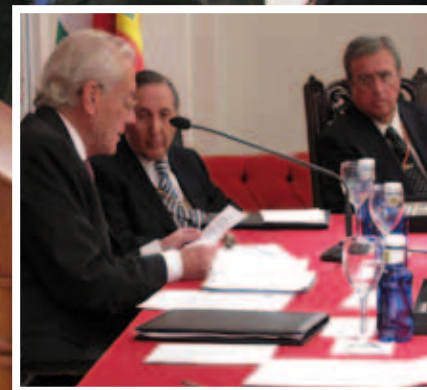
Apertura de Plicas