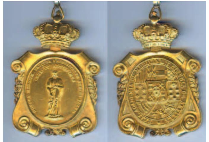
Foto: Medalla de la Academia

Tiene que ser en el "Estatuto de las Reales Academias de Medicina de Distrito" del año 1886 cuando se describe la Medalla académica diciendo que "los Académicos usarán como distintivo una medalla de oro numerada, con el emblema de la medicina en el anverso y el título de la Academia en el reverso, pendiente de un cordón de seda entrelazado de color amarillo y morado,