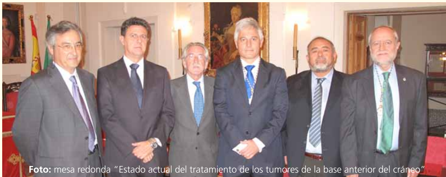
Foto: mesa redonda "Estado actual del tratamiento de los tumores de la base anterior del cráneo"